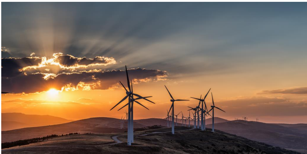
Puesta de sol en Oncala por José Ignacio Ciria Espuelas 2º Premio Eolo de Fotografía 2023

Y el tercer premio ha recaído en el trabajo ‘Regateando a los gigantes del viento’ de Matías Ramírez . La instantánea fue tomada este mismo año en el sur de Francia, en una zona rural donde los parques eólicos están rodeados de viñedos.