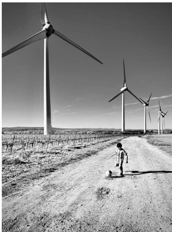
Regateando a los gigantes de viento por Matías Ramírez 3º Premio Eolo de Fotografía 2023

Y el tercer premio ha recaído en el trabajo ‘Regateando a los gigantes del viento’ de Matías Ramírez . La instantánea fue tomada este mismo año en el sur de Francia, en una zona rural donde los parques eólicos están rodeados de viñedos.